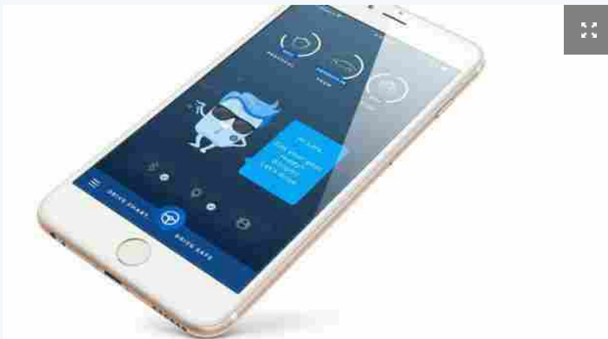
Smartphone alla guida, arriva sensore che inibisce schermo